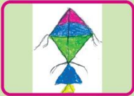
Nuzhat Tabassum Class 1 B (NC)