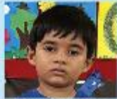
Shreyan Das Gupta Nursery A