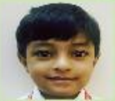
Maher Juhan Bin Salman Nursery