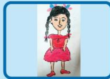
Iraboti Zafran Hoque Nursery B (CC)