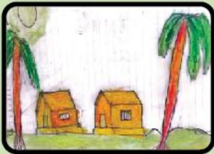
Aidan Nusyr Hossain Class 1 B (NC)