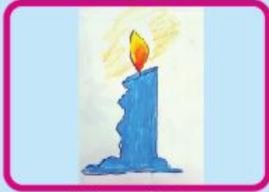
Mohammad Azim Playgroup (CC)