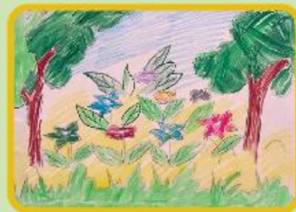
Ismail Hussein Class-1 B (CC)