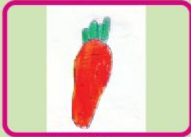
Md. Saif Al Din Rafin Playgroup (NC)