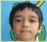
Sheikh Zamila Play Group