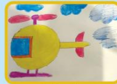
Arnisha Saha KG B (CC)