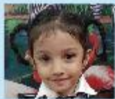
Zaayra Nawal Play Group