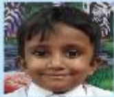
Abrar Ayesh Play Group