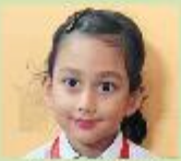
Shuhairah Sanabil Nursery