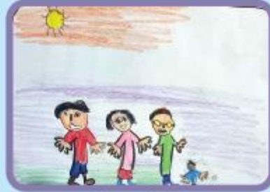
Rizvan Kabir Nursery A (CC)