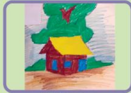
Ahnaf Jabin Ayaan KG B (CC)