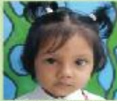
Hidaya Marium Ayra Play Group