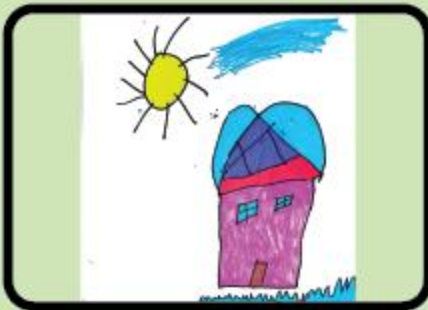
Azmina Zaheen Playgroup (NC)