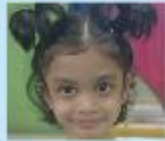
Warisa Farzeen Play Group