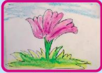
Zaayra Nawal Playgroup (CC)