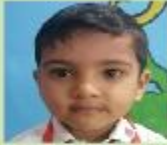
Md. Saif Al Din Rafin Play Group