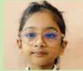
Anabia Fatima Inaaya Nursery