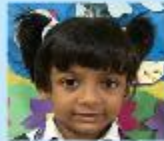
Progga Prachurjo Nursery A