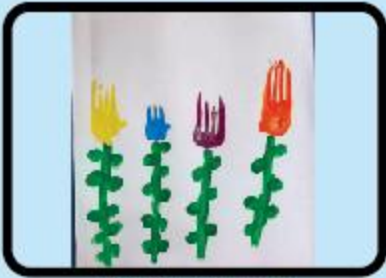
Hurijihan Ahmed Nursery A (CC)