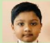
Kazi Faizan Arham Nursery