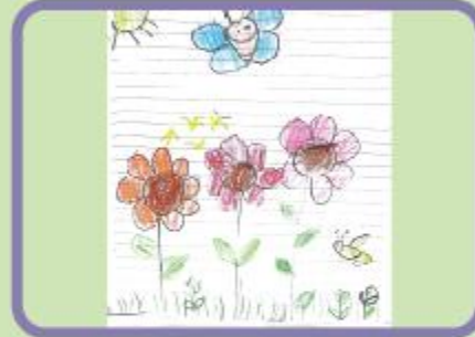
Ibada Islam Anabia Playgroup (NC)