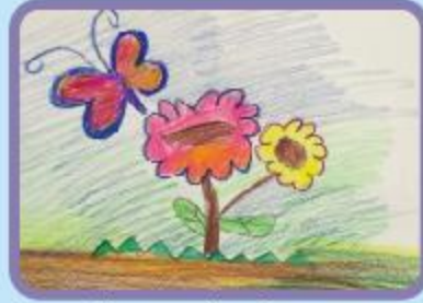
Shreyan Das Gupta Nursery A (CC)