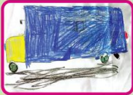
Mohammad Rafsan Bin Faysal Playgroup (NC)