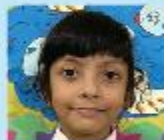
Hunjihan Ahmed Nursery A