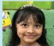
Nusaf Mahjabin Nursery A