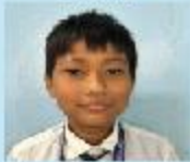
Nyai Thowai Ching Mamma Messi Grade 3 B