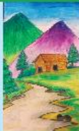
Shamratuz Jahan Grade 1 A (CC)