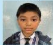
Uchawnu Mama Grade 4 B