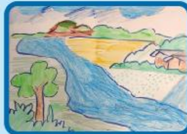
Nahiyah Al Nafi Grade 1 B (CC)