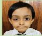
Saifan Adnan Nursery