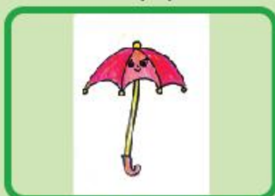
Ridhi Sarker Class 1 B (NC)