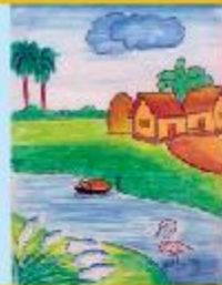
Afraima Arman Waziha Grade 1 A (CC)