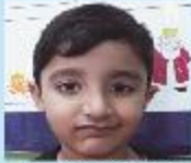
Mohammad Azim Playgroup