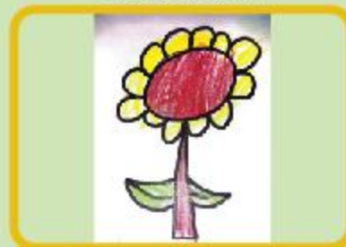
Ibada Islam Anabia Nursery (NC)