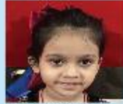
Inayra Saba Haiat Nursery A