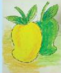
Hasan Zarar Ali Playgroup (CC)