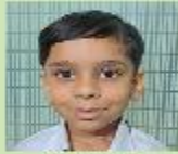
Towsef Islam Play Group