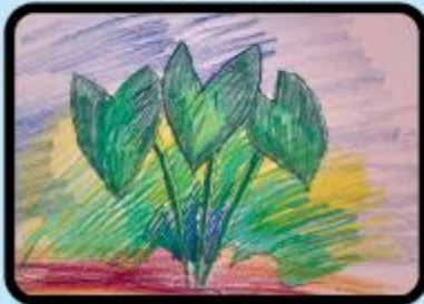
Naseef Raiyan Nursery B (CC)