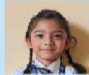
Ibtat Tabassum Fatiha Nursery B