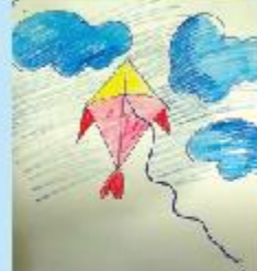
Nuzaira Islam Ayat Nursery A (CC)