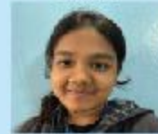
Sidratul Muntaha Grade 5 A