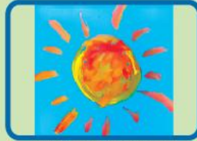
Manha Farnaj Chowdhury Playgroup (NC)