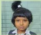
Manha Farnaj Chowdhury Play Group