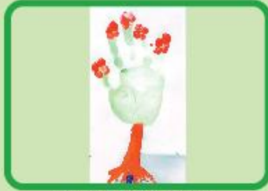
Towhid Islam Doruk Playgroup (NC)