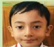
Partha Protim Barua Nursery