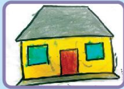
Zuhaib Ibne Hasnat Playgroup (NC)