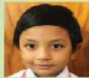
Kritika Biswas Nursery