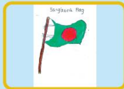
Ruknin Sadid Class 1 A (NC)