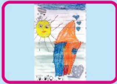
Azmina Zaheen Playgroup (NC)