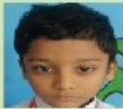
Ahnaf Tahan Play Group