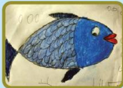
Arabi Ayat KG (NC)