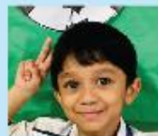
Naeman Ahmed Nursery A