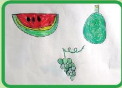
Yalena Fareen KG A (CC)