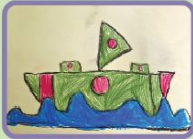
Md. Zabir Zawad Nursery-A (CC)