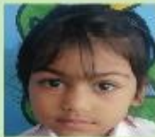
Ibadia Islam Anabia Play Group