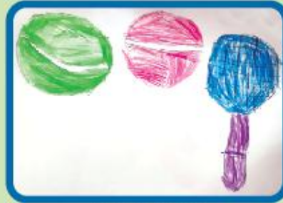
Aaraf Ahmed Nursery-B (CC)