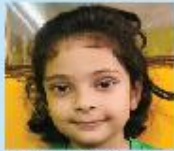
Wafiqah Manha Hoque Playgroup