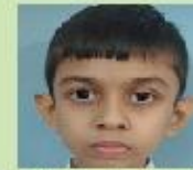
S.M Muhtashimul Mowla Class 1B