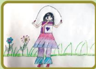
Nazeha Mahmood Grade 1 A (CC)