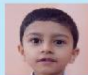
Mohammed Tajuyat Nursery B