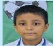
Tasbiul Hosen Ayat Nursery A