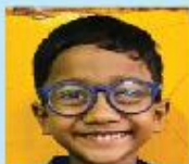
Rizvan Kabir Nuhad Playgroup