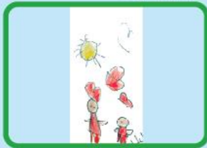
Safwan Mahboob Nursery (NC)