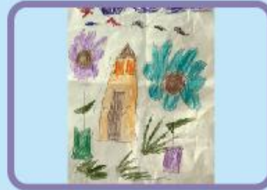
Partha Protim Barua Nursery (NC)