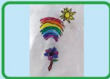
Sharleez Nawar Ariah Nursery (NC)