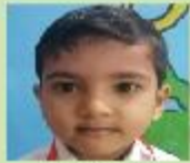
Saif Al Din Rafin Play Group