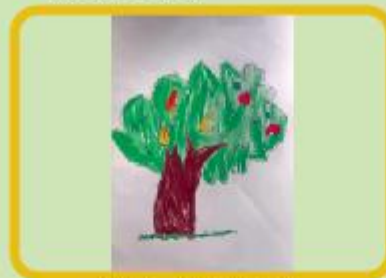
Wafeeq Ibtihal Gazi KG B (CC)