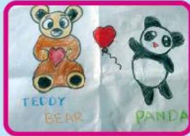
Kritika Biswas Nursery (NC)