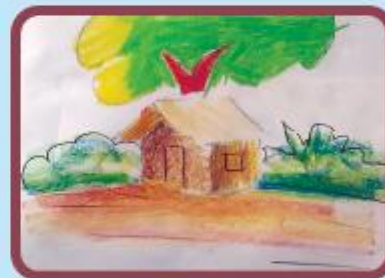
Aytan Noori KG (NC)