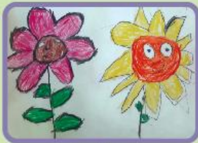
Adila Anjum Nursery-A (CC)