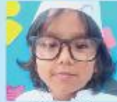
Minimita Nath Nursery B