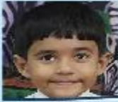
Shreyan Das Gupta Playgroup