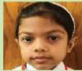
Sayuri Ayana Nursery