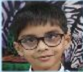
Mohammad Mahad Haseeb Playgroup