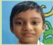
Mohammad Rafan Bin Faysal Play Group