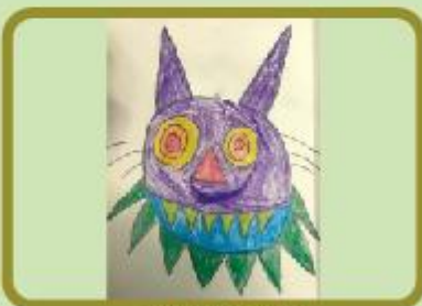
Aniruddha Shil Grade 1 A (CC)