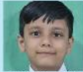
Tasbiul Hosen Ayat Nursery A