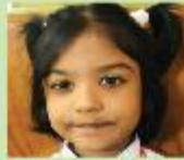
Wafiza Ahasan Rafi Nursery