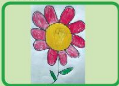
Purnota Dwari Medha KG A (CC)