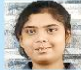
Sidratul Muntaha Grade 5A