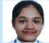
Sidratul Muntaha Grade 4B