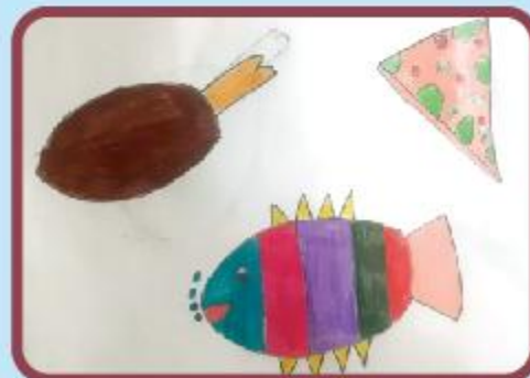
Aysha Chowdhury KG B (CC)