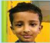
Iyaed Chowdhury Azaan Playgroup