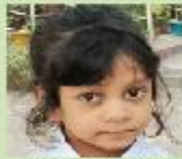
Yusra Arafat Airah Nursery