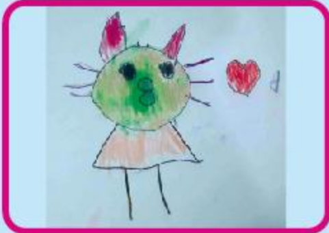
Lagnajita Barua Playgroup (CC)