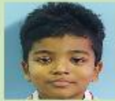
Safwan Mahboob Nursery