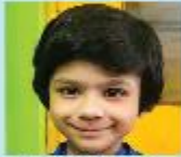
Iraboti Zafraan Hoque Playgroup