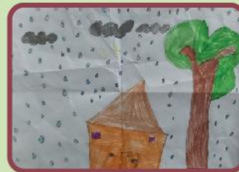
Samawah Mahveen KG A (NC)