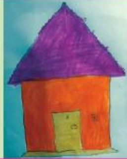
Arabi Ayat KG A (NC)