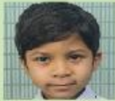
Zuhaib Ibne Hazrat Play Group