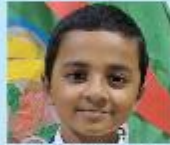
Md. Zabir Zawad Nursery A