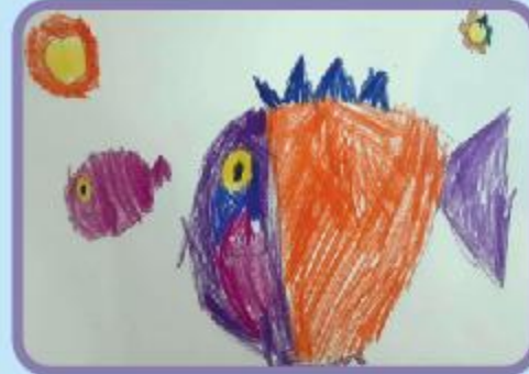
Shreyan Das Gupta Playgroup (CC)