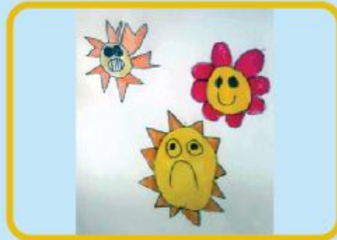
Arshia Inayat Nursery B (CC)