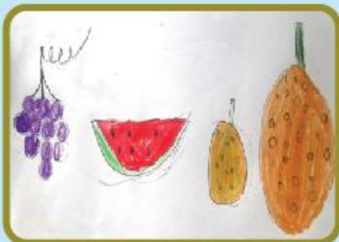
Purnota Dwari Medha KG A (CC)