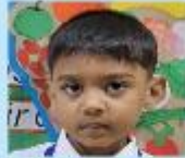
Md. Shaharar Jamal Fardin Nursery A