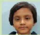
Arabi Ayat KG A