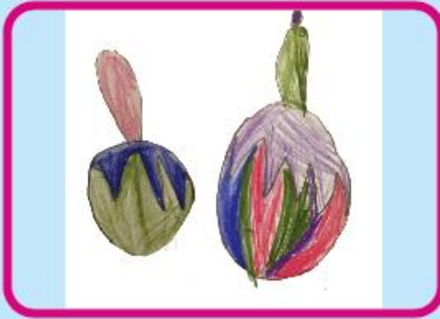
Numaira Afroz Play Group (CC)