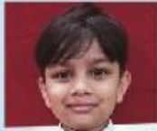
Mohammad Saik Abdullah Sedhan Playgroup