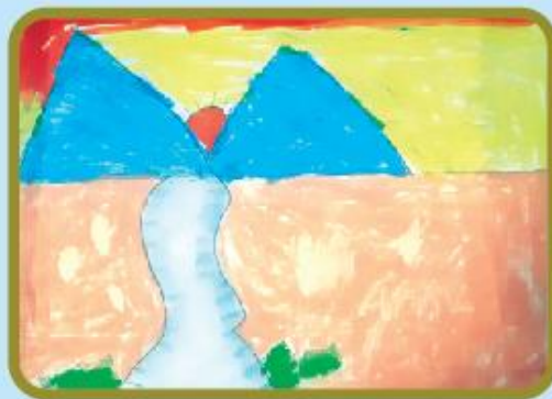
Ulfat Zaiyam Grade 1 B (CC)