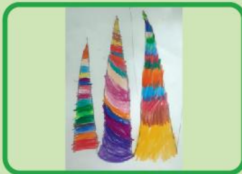
Faiza Jannat Nursery A (CC)