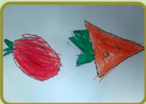
Hurijihan Ahmed Playgroup (CC)