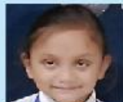
Samantha Anan Nursery A