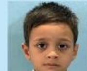
Arhab Tawfi KG B