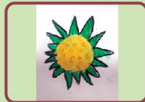
Mrinmita Nath Nursery B (CC)