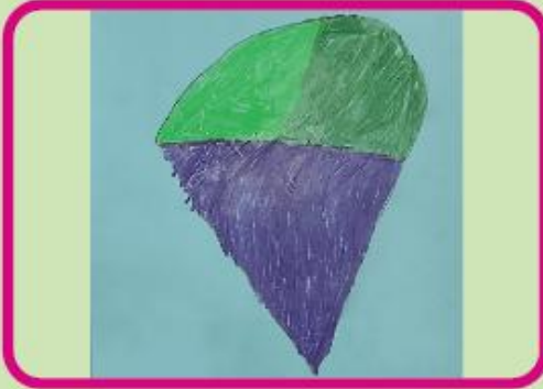
Arabi Ayat KG A (NC)