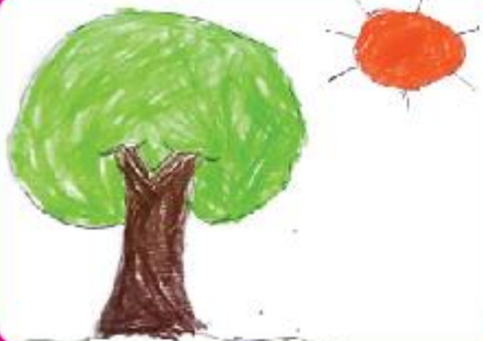
Anabia Fatima Inaaya Play Group (NC)