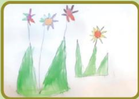
Waniya Hossain Unaisha Nursery B (CC)