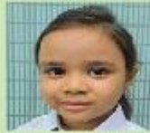
Samawah Sultana Mahveen Nursery