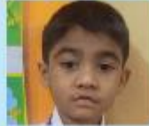
Prayash Saha Nursery B