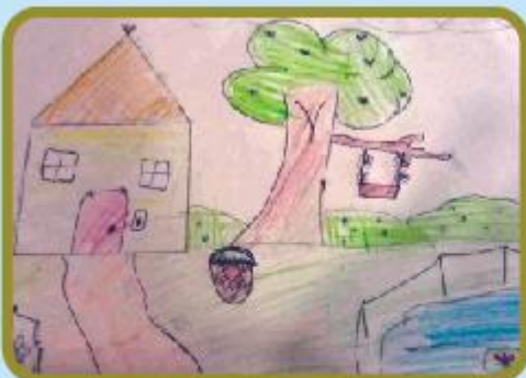
Faradwan Farasa Class 1A (NC)