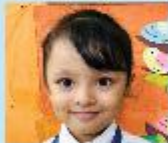
Nusafa Mahjabin Playgroup