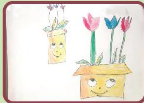
Yalena Fareen KG A (CC)