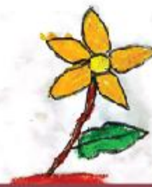
Wasifa Hossain Aziza Nursery (NC)