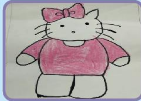
Ayesha Yamar Asif KG B (NC)