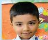
Arzaan Saad Playgroup