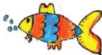
Umair Asfar Ayham Nursery (NC)