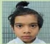
Sohaifa Alam Esma Nursery