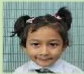
Shuhairah Sanabil Playgroup