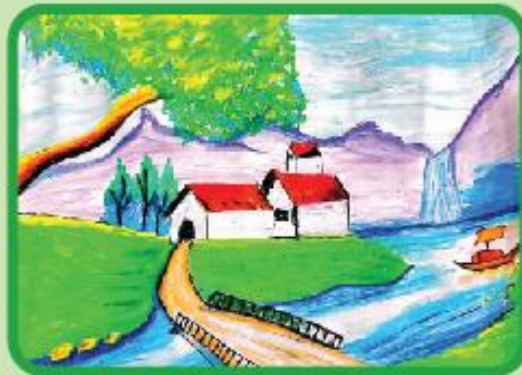
Lakshmi Chandni Weerakoon Nursery (NC)