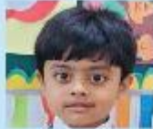
Ayushman Chowdhury Nursery A