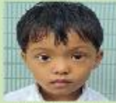
Uchingma Marma Playgroup