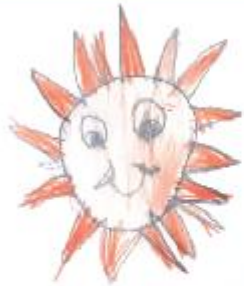
Hurijihan Ahmed Play Group (CC)