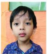
Syed Aabanur Rahman Playgroup