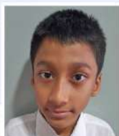
Saif Al Din Class - 3B