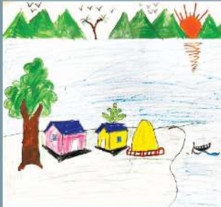
Ridhi Sarker Nursery (NC)