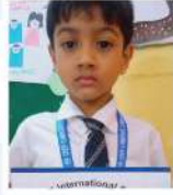
S. M. Zayd Tahir Nursery B