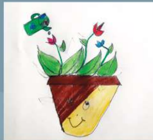
Ayesha Chowdhury KG B (CC)