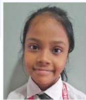
Manha Naimat Islam Class - 3B