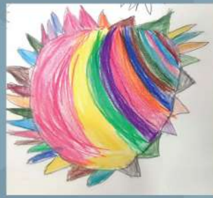
Faiza Jannat Nursery A (CC)