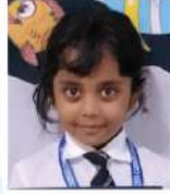
Purnota Dawari Medha KG A