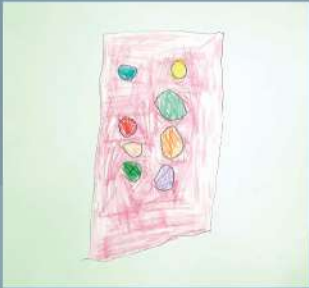
Arzaan Saad Playgroup (CC)