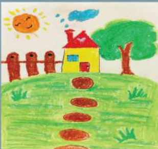
Lakshmi Chandni Weerakoon Nursery (NC)