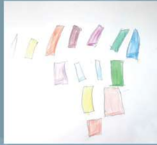
Numaira Afroz Playgroup (CC)